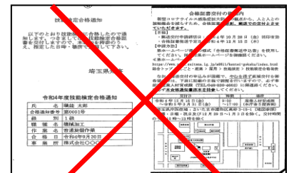
こちらは合格証書ではありません。